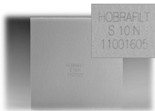
Рис. 2. Выходная часть фильтра-картона